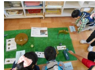
地雷レプリカ学習

学習内容や所要時間については目安になっています。組み合わせて行うことも出来ますので、依頼ごとにご相談ください。また、オンライン対応も可能となっています