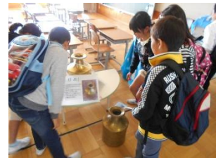
水がめを運ぶ体験学習