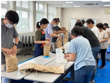
フードバンク茨城と連携した 食料支援活動