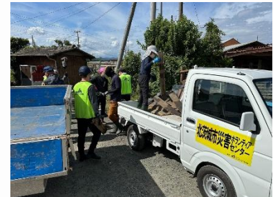
災害ボランティアへの参加