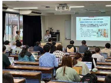
茨城大学ボランティア講座