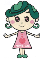
JA日立市多賀 イメージキャラクター ゆめたがちゃん