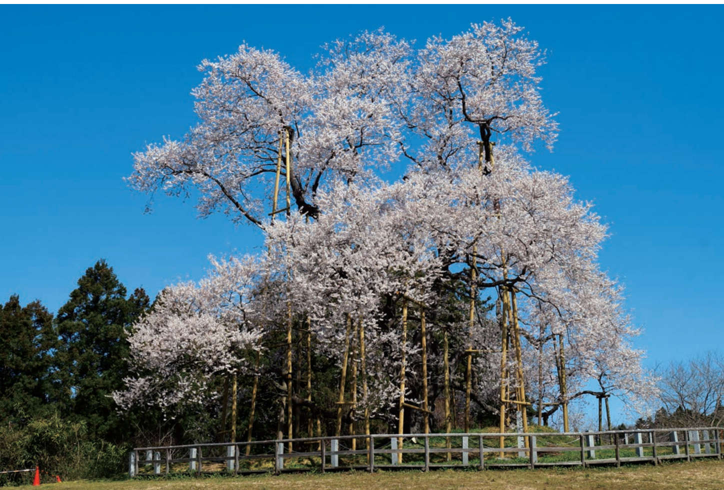
「戸津辺の様」 福島県白川郡矢祭町 エドヒガンザクラ 樹齢600年超