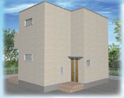
※外観イメージとなりますので、実際の施工と異なる場合があります。予めご了承ください。