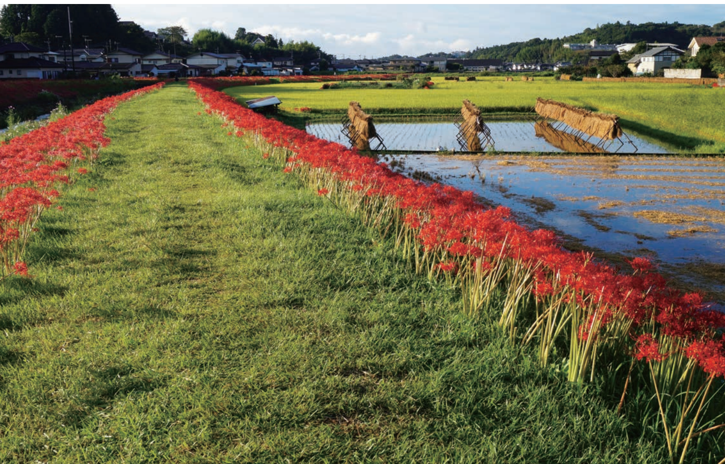
「収穫の季節(とき)」(常陸太田市)