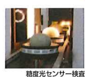
糖度光センサー検査

メロンに添付してあるQRコードを携帯電話に読みこませると生産者名や糖度、食べごろも掲載、管理も徹底しています。