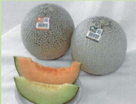
クインシーメロン・アンデスメロン