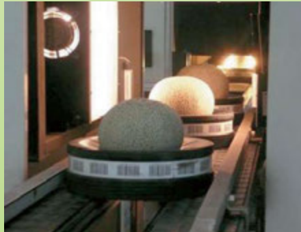
糖度光センサー検査