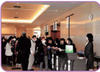
受付の大勢のお客様