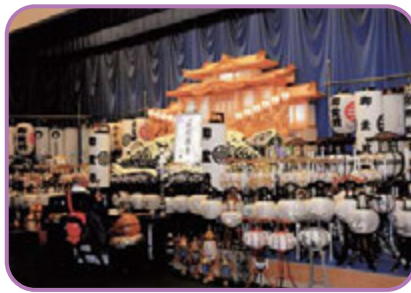
千福寺ご住職による供養