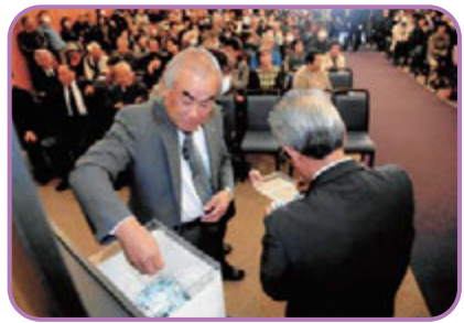
盛り上がりを見せた抽選会