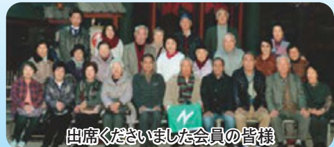
出席くださいました会員の皆様