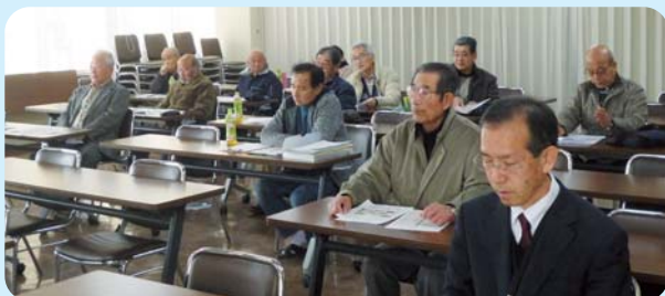
熱心に講演に聞き入る皆様