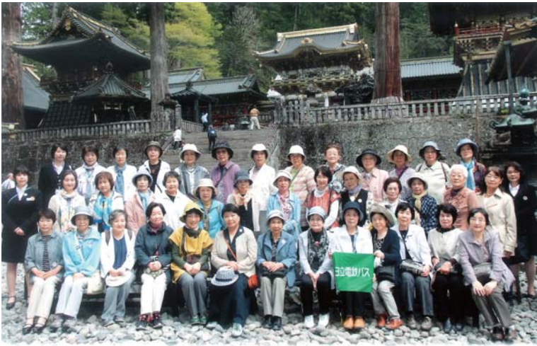
世界文化遺産参拝記念 平成29年5月9日 於日光東照宮

この度、女性部の行事として、ホテルエピナール那須に於いて、和食マナーの研修を実施しました。