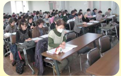
女性部通常総会の様子