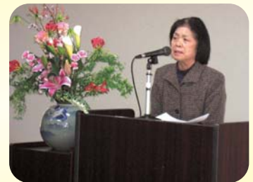
いずみの会総会の様子