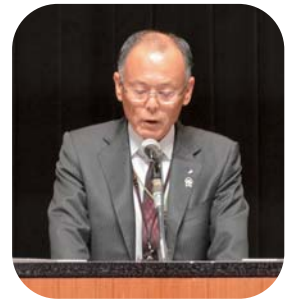
挨拶をする 鯨岡組合長