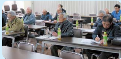
熱心に講演に聞き入る皆様

参加された皆様も熱心に耳を傾 けられ、質問も多数あり、大変有意義 な研修会となりました。