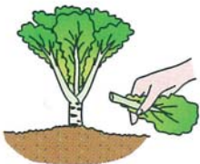
下の方の葉から順次かき取る