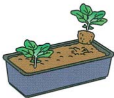
長型のプランターなら2株植えに