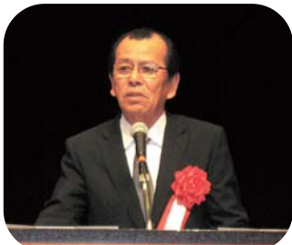
茨城県議会議員 菊池敏行氏