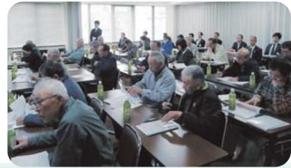
相続セミナーの様子