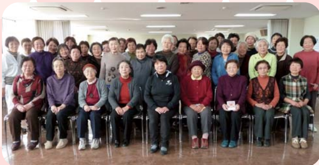
参加された女性部の皆様