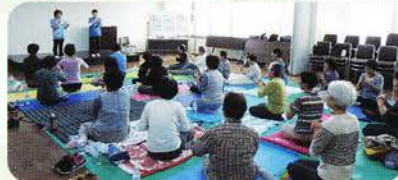
参加された女性部の皆さん