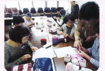
参加された女性部の皆さん