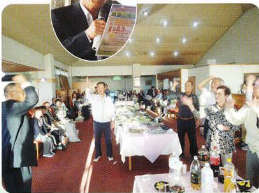
ジャンケン大会の様子